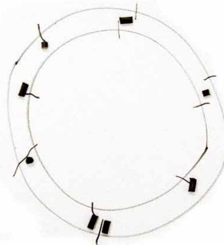
Atelier Veldwerk / Oktober 2009