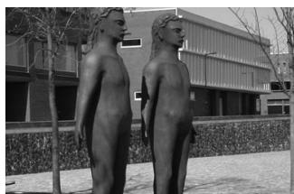
Locatie: P.E. Tegelbergplein, eiland Sporenburg (Zeeburg), Amsterdam Opdrachtgever: Werkgroep Kunst Oostelijk Havengebied

Aan de rand van het P.E. Tegelbergplein in Amsterdam kijken twee gietijzeren mensfiguren uit over het water. Zij staan op een tafel, erachter staat een stoel en voor de tafel staat een 'dubbele emmer'. De scène is een kopie van een fragment uit 'Zelfportret als gebouw', een veelomvattend werk waar Mark Manders sinds 1986 aan werkt en waarvan hij sinds 1990 fragmenten toont.