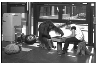
Techniek: Demcon Locatie: St. Maartenskliniek, Ubbergen Opdrachtgever: SKOR

De kliniek staat in een bos. De orang-oetang bevindt zich in een publieke ruimte van een revalidatiekliniek en kan bewegen en reageren op prikkels van buitenaf. Het is een interactief object, dat de aanwezigheid van mensen opmerkt. Een heel ingewikkeld 'ding', met rug- en gelaatsspieren. De aap heeft menselijke trekjes en zijn gedrag is onvoorspelbaar. Soms kan je als patiënt een spelletje met hem spelen (boter, kaas en eieren). Als hij zin heeft.